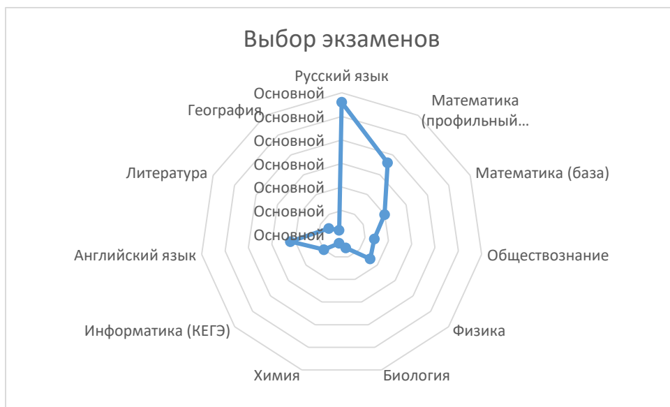
Диаграмма 1 Сравнительный анализ выбора экзаменов в 2023/2024 уч.г.